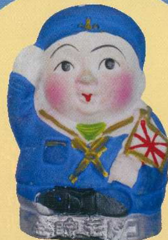
こども貯金箱(水兵)