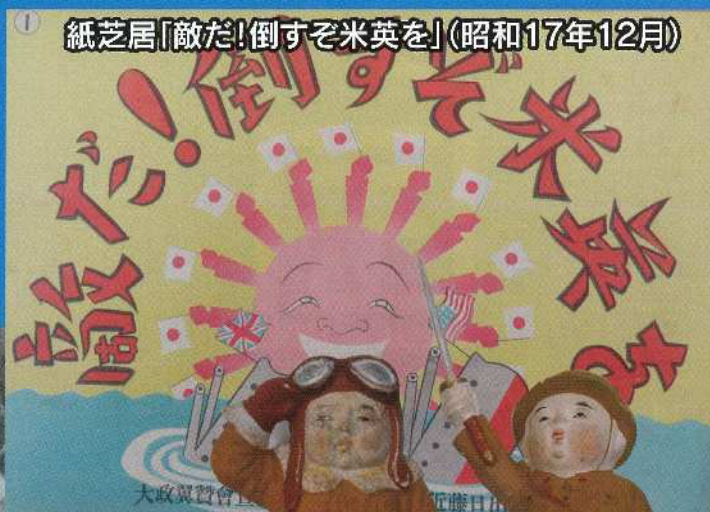
戦時中の土人形(兵士と飛行兵)