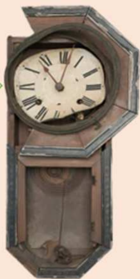
「被爆時計」 原爆が投下された時刻、 11時2分 で時間が止まっている