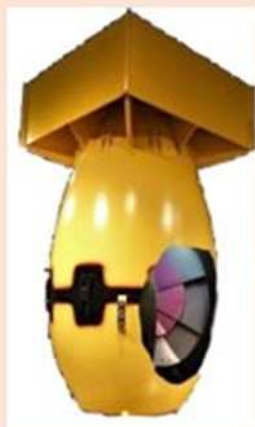
「ファットマン」 実際に長崎へ 落とされた 原子爆弾