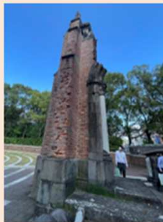
「旧浦上天主堂」 実際に長崎へ被爆した旧浦上天主堂の遺構。東洋一の壮大さを誇る浦上天主堂だったが、原子爆弾の炸裂によって破壊され、壁の一部が僅かに残るのみとなった。